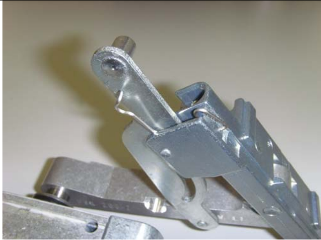
Gebrochene oder verbogene Feder.