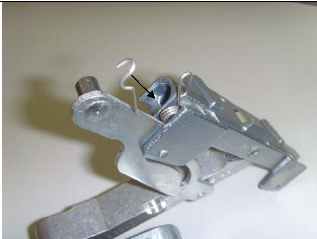
Neue Feder in das Gehäuse einschieben