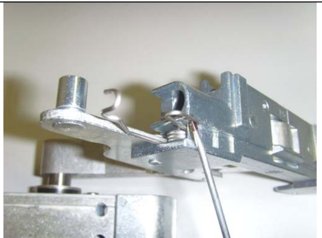
Feder mit Schraubendreher über die Kante ziehen